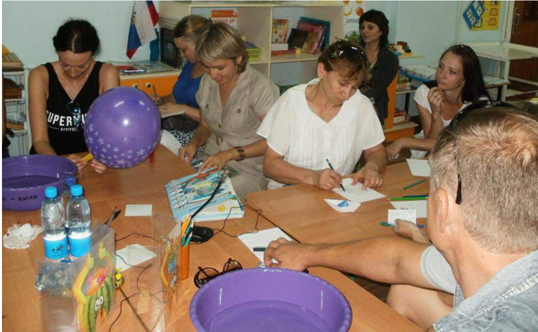
Мастер-класс по артикуляционной гимнастике