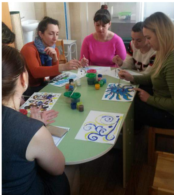
мастер-класс для педагогов